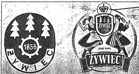
Znaki firmowe Browarów „Żywiec” z różnych okresów. Znakiem spornym jest obecnie używany znajdujący się z prawej strony.

Ta korona ma zniknąć ze znaku firmowego Browarów „Żywiec”.